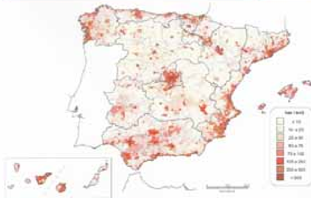
Figura 10. Densidad de población (2001) y zonas de protección (2001).